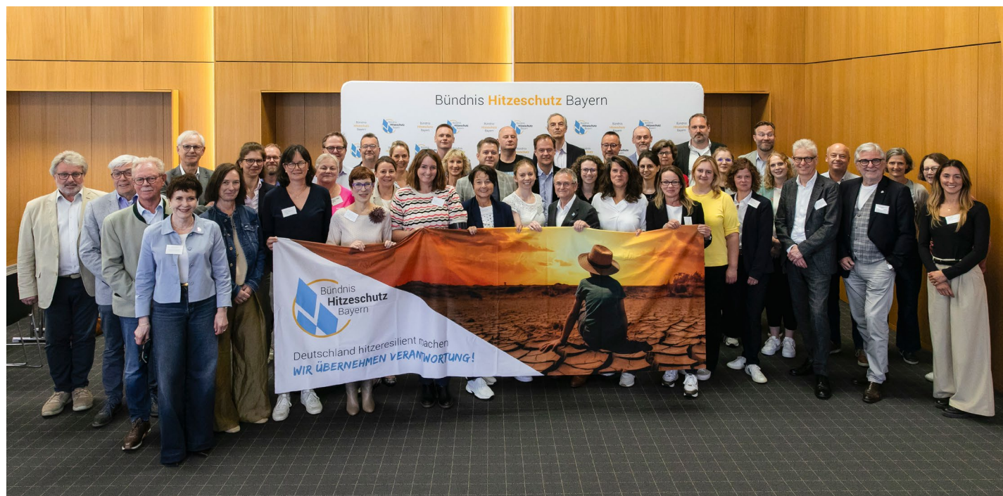
Gemeinsam stark für Hitzeschutz: Die Mitglieder des Bündnis Hitzeschutz Bayern im Veranstaltungssaal der Bayerischen Landesärztekammer.

Ich fordere eine gemeinsame Anstrengung und ein aufeinander abgestimmtes Handeln aller Verantwortlichen, die die Resilienz und den Schutz der Bevölkerung bei Hitze verbessern können: die Themen sind mit Wassermangel, Aufheizung von Flüssen durch Kühlwasser, Tempolimits und viele mehr, gesetzt und zahlen letztlich auf nicht weniger ein als auf die Gesundheit der Bevölkerung – mehr noch, es geht um Planetary Health. Handeln wir jetzt.