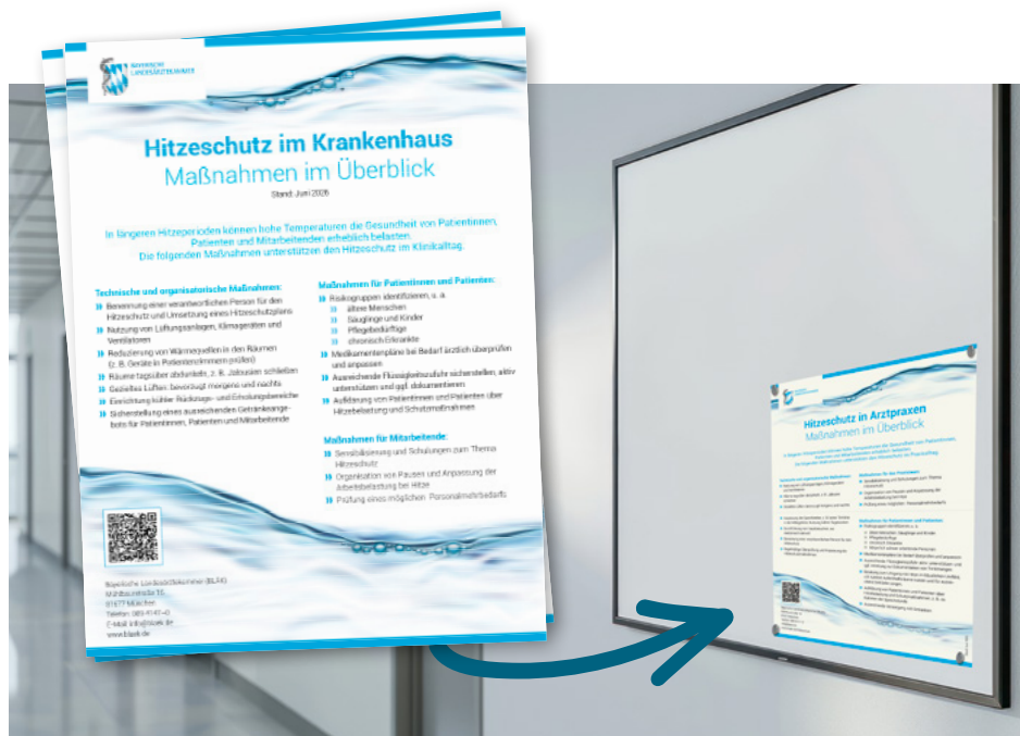
In der Heftmitte (Seite 307 ff.) finden sich Musterhitzeschutzpläne für Arztpraxen und Kliniken als Poster zum Herausnehmen und Aushängen.