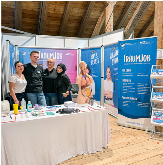
Reger Andrang am BLÄK-Messestand

Im Mittelpunkt der Messeauftritte der BLÄK stand das Berufsbild der Medizinischen Fachangestellten (MFA). An beiden Standorten informierten sich zahlreiche Besucherinnen und Besucher in persönlichen Gesprächen über Zugangsvoraussetzungen, Ausbildungsinhalte, Karriereperspektiven sowie alternative Wege im Gesundheitswesen. Neben vielen geplanten Gesprächsterminen ergaben sich auch zahlreiche spontane Beratungen, die intensiv genutzt wurden.