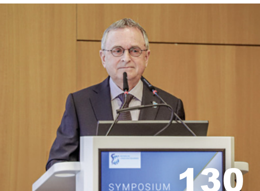
BLÄK-Präsident Quitterer beim Symposium Ärztliches Handeln in Zeiten Künstlicher Intelligenz