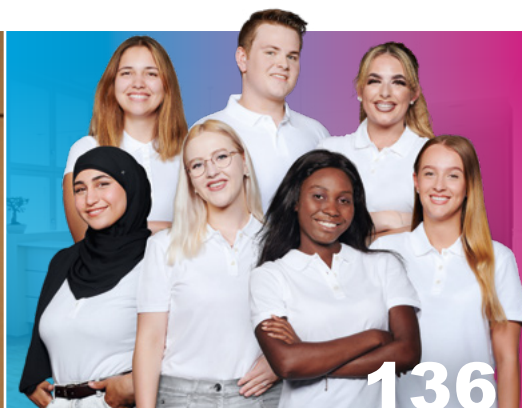
Ausbildung von Medizinischen Fachangestellten: Wichtige Hinweise