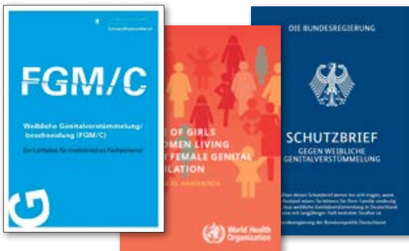
Abbildung 1: Titelbild des Kittelleitfadens entstanden in Kooperation der Stadt München mit dem Münchner Netzwerk gegen FGM/C, WHO Broschüre, Schutzbrief der Bundesregierung, (v. li.).

Viele der Frauen leiden an den individuell unterschiedlichen Folgen von FGM/C. Diese reichen von starker Dysmenorrhoe, Harnwegskomplikationen wie Inkontinenz, Narbenbildung, Zysten, Fisteln, Problemen bei Sexualität und Reproduktion [9], bis zu Hautschäden, Geruchsbildung, Gang- und Haltungsstörungen. Psychische Symptome sind vielfältig, wie Gefühle von Unvollständigkeit, Min-