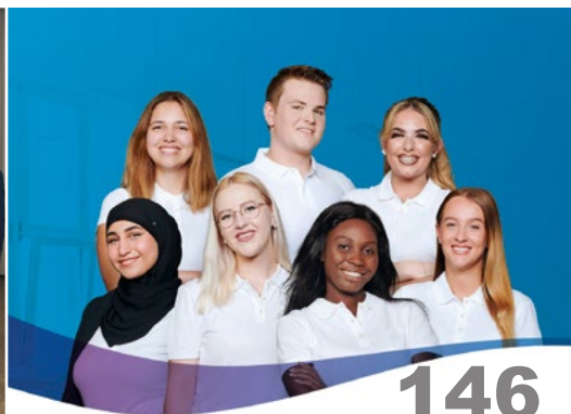
Einstellungshinweise Medizinische/r Fachangestellte/r