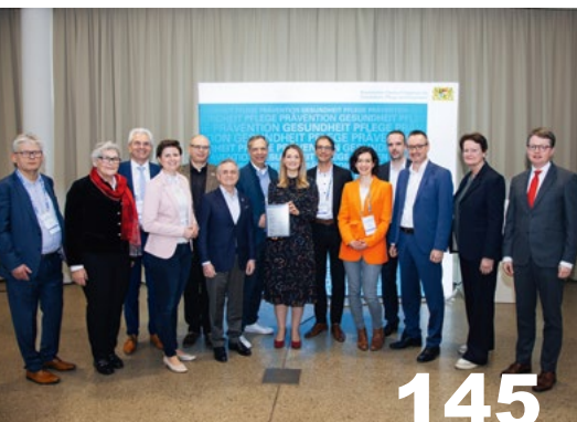
Start-ups im Gesundheitswesen