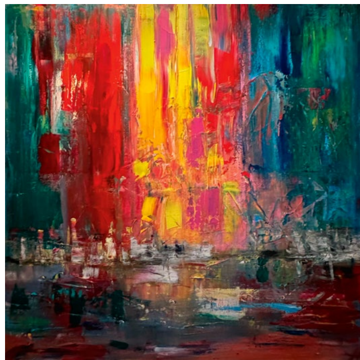
Unsere Instagram-Community hat entschieden: Das Bild „Segelboote im Sonnenuntergang“ ist unser Meisterwerk des Monats November. Gemalt wurde es von Helena Vidic, Fachärztin für Allgemeinmedizin aus Poing. Durch Nutzung der leuchtenden Farben und intensiver Übergänge hat die Künstlerin versucht diese Faszination zu vermitteln. Das Wasser wurde mit Reflexionen versehen, um das Bild zu beleben und um die Raumillusion zu vertiefen.

Zur Abstimmung finden Sie uns unter: www.instagram.com/aerztekammerbayern/