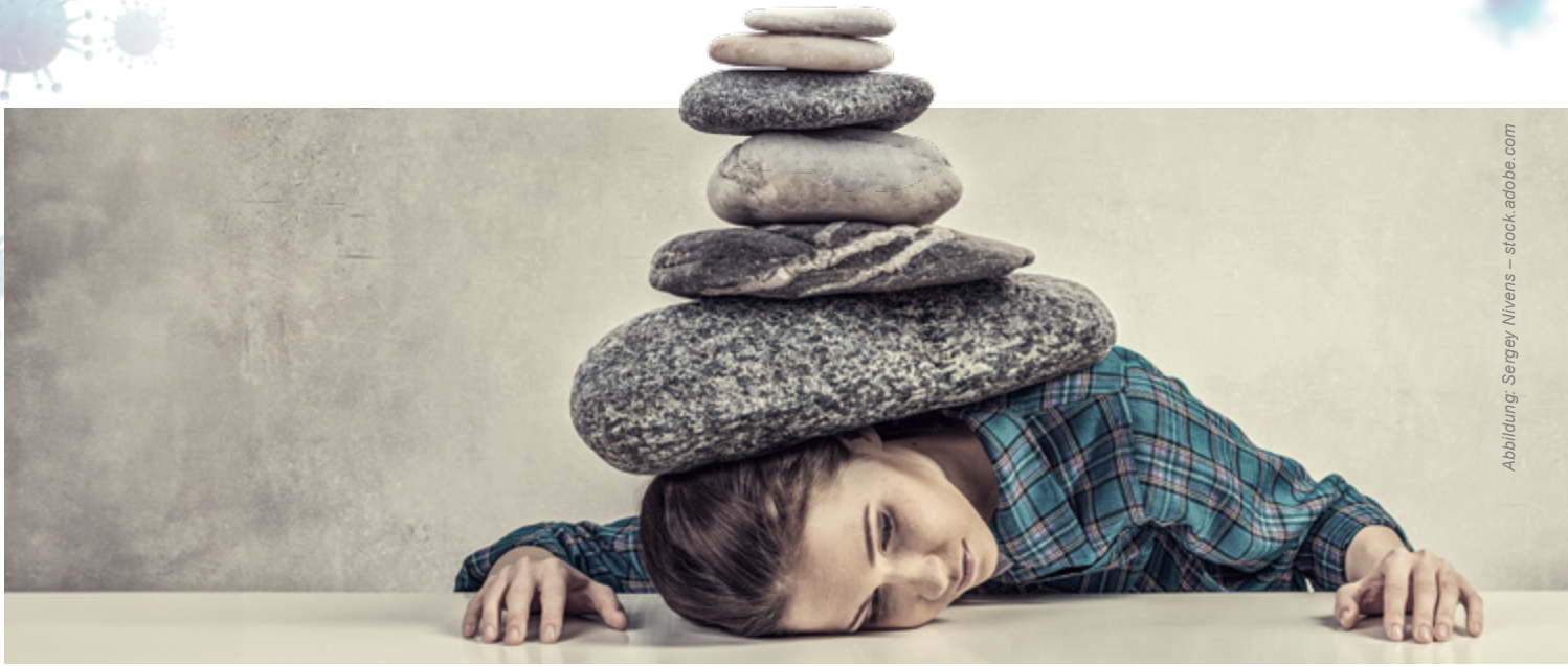
Abbildung: Sergey Nivens – stock.adobe.com

Eine kurze Übersicht zum Stand von Forschung und Versorgung.