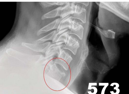
Blickdiagnose an der Halswirbelsäule