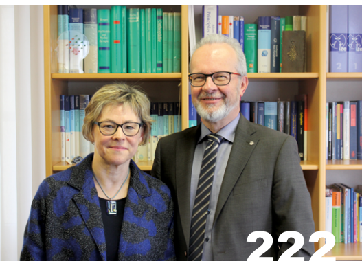
Schlaganfall-Helfer in Ansbach