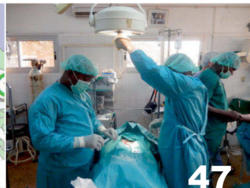
Santé pour tous