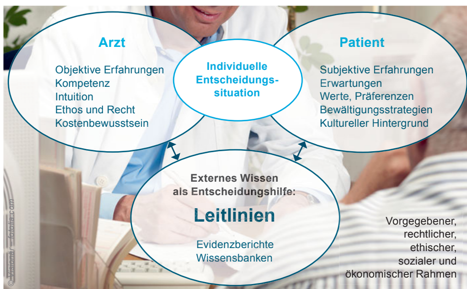
Abbildung: Stellenwert von Leitlinien in der individuellen Versorgung.