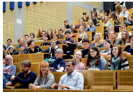
Im Klinikum Großhadern der LMU München fand die 100. Veranstaltung des Projekts „Schulen in die Transplantationszentren“ statt.