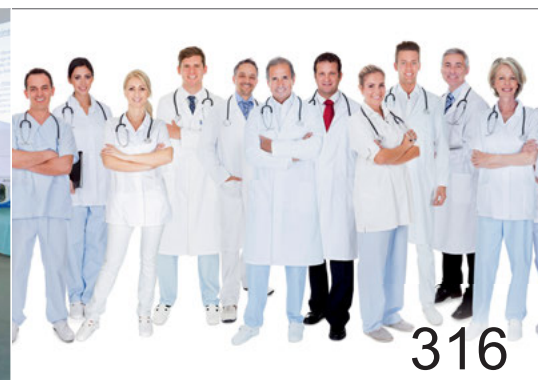
Auszubildende zur Medizinischen Fachangestellten.