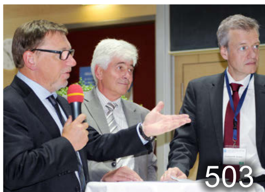
47. Kongress der Deutschen Gesellschaft für Allgemein- medizin und Familienmedizin.

Vier Kompetenzebenen der neuen Muster-Weiterbildungsordnung.