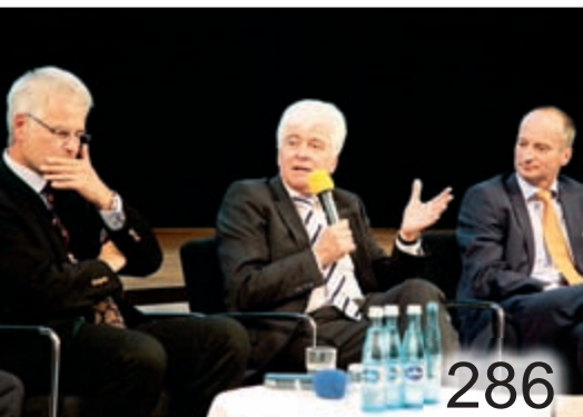
Podiumsgespräch anlässlich des Bayerischen Apothekertags 2013

Titelbild: Bronchiolen und Alveolen.