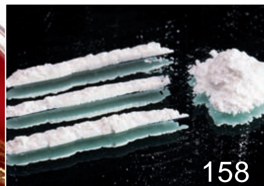
Modedroge – Crystal auf dem Vormarsch