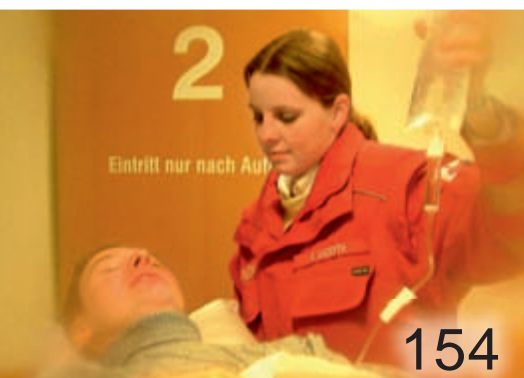
Time is life – bei Sepsis

Titelbild: Human papillomavirus (HPV)