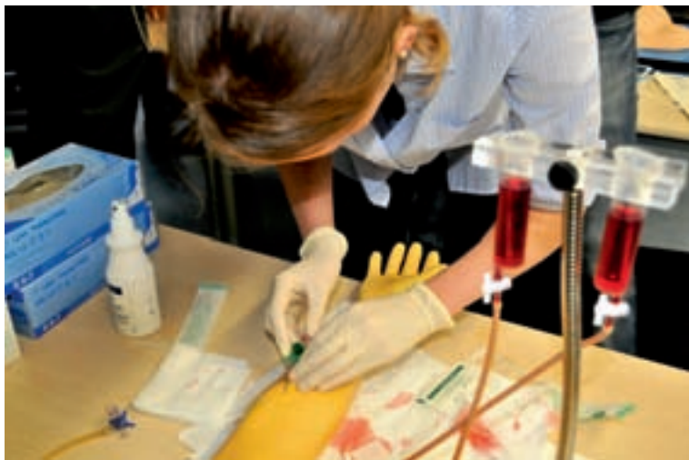
Abbildung 4: Station „Injektion“ am Refresh-Tag.