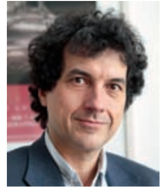
Professor Dr. Ernst Tamm

Das hieraus entstandene curriculare medizinisch-didaktische Fortbildungsangebot umfasst zwei Module mit 32 Arbeitseinheiten (AE) im Moduls (Grundkurs/Aufbaukurs) und 14 AE im Modul zwei (dokumentierte Praxisphase). Insgesamt sollen 46 Arbeitseinheiten à 45 Minuten absolviert werden. Für die Zukunft wird die Anerkennung des Abschlusszertifikats aus dem Medizindidaktik-Curriculum für die Anforderungen der jeweiligen Habilitationsordnungen durch die Medizinischen Fakultäten Bayerns angestrebt.