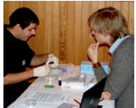
Abbildung 2: OSCE-Prüfung (Objective Structured Clinical Evaluation).

An vielen Medizinischen Fakultäten mit ihren Universitätskliniken und akademischen Lehrkrankenhäusern war es – und ist es leider noch vereinzelt – üblich, die Studenten im letzten Jahr ihrer klinischen Ausbildung, dem Praktischen Jahr (PJ), als willkommene kostenlose Arbeitskräfte im Routinebetrieb, zum Beispiel zum Blutabnehmen und Hakenhalten, einzusetzen, ohne sich viel um Übermittlung von Inhalten oder eine kontrollierte Qualität der Ausbildung in diesem Jahr zu kümmern. Das Kompetenzzentrum Praktisches Jahr an der TUM machte es sich daher zur Aufgabe, die Lehre in diesem letzten Studienabschnitt durch folgende Programme nachhaltig zu verbessern: