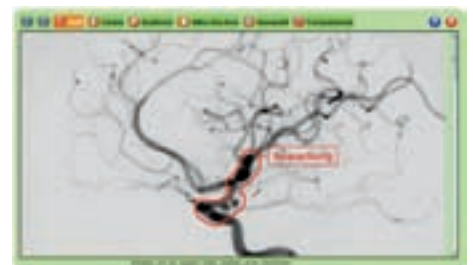
Abbildung 3: Screenshot von CaseTrain.