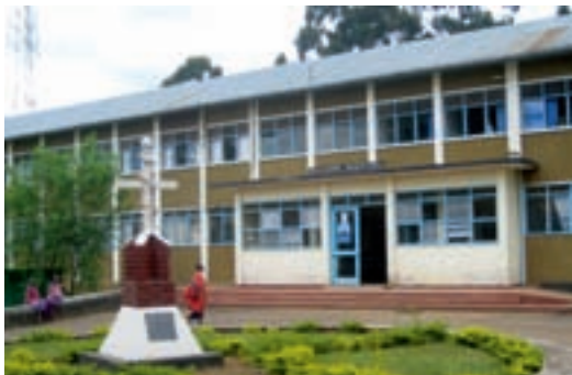
Machame-Hospital in Tansania.