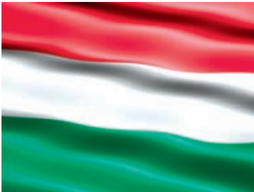
Medizinstudium in Ungarn.

Titelbild: Kinder.