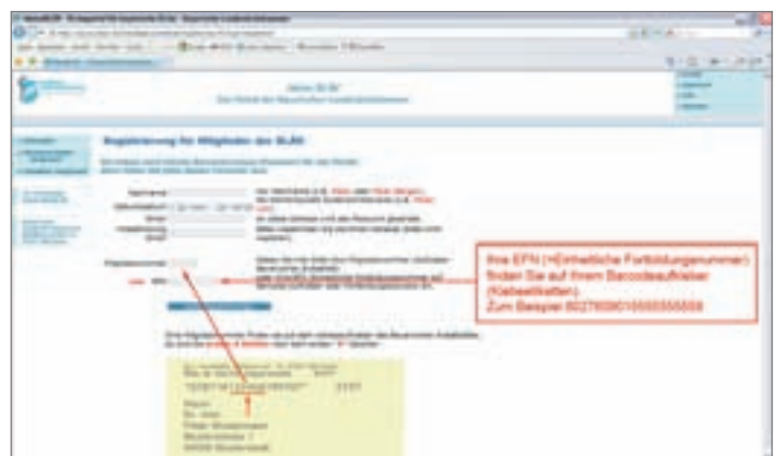
Abbildung 2 c: Um den Online-Zugang beantragen zu können, füllen Sie bitte diese Maske aus. Ihre Mitgliedsnummer entnehmen Sie beispielsweise dem Adressaufkleber des „Bayerischen Ärzteblattes“.