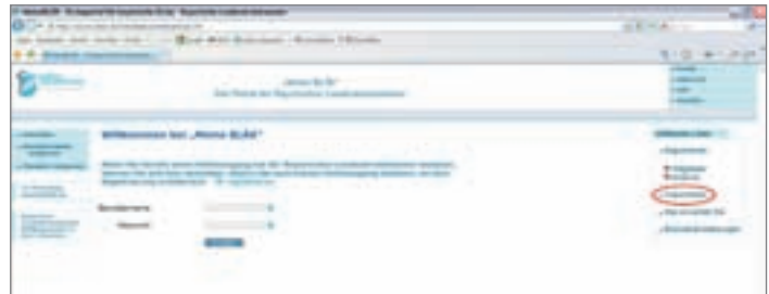
Abbildung 3: Bitte aktivieren Sie nun den Link „Freischalten“ unter „Hilfreiche Links“ auf der Anmeldeseite des Portals.

Hinweis: Bevor Sie nun Ihr Fortbildungskonto einsehen können, werden Sie noch mit einigen Fragen konfrontiert werden, zum Beispiel mit den Fragen nach der sozialrechtlichen Fortbildungspflicht, nach Zulassungsdatum und ob Sie eine Übertragung Ihrer Daten an die Kassenärztliche Vereinigung Bayerns (KVB) wünschen. Mit Ihrem Einverständnis und mit Erreichen der 250 Punkte im Fünfjahreszeitrahmen können Sie die Bestätigung nach § 95 Sozialgesetzbuch V GKV-Modernisierungsgesetz – GMG 11/2003 selbst ausdrucken oder durch die BLÄK direkt an die KVB übermitteln lassen.