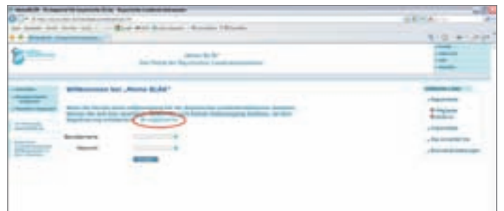
Abbildung 2 a: Bitte den Link „Registrieren“ aktivieren.

Sofern Sie noch keinen Online-Zugang besitzen, ist als erstes eine Registrierung erforderlich (siehe Abbildung 2 a, b, und c). Eine Registrierung ist nur einmalig durchzuführen. Wenn Sie bereits einen Online-Zugang bei der BLÄK besitzen, können Sie sich hier anmelden.