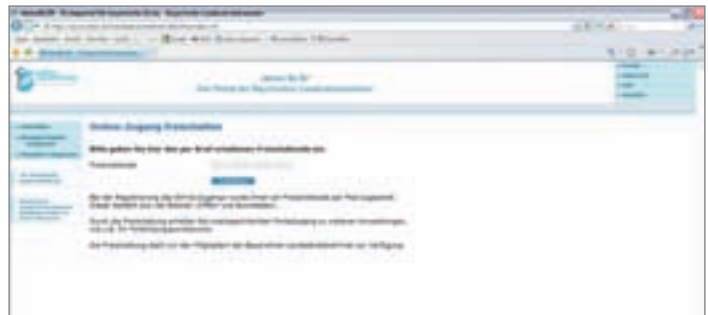
Abbildung 4: Der Freischaltcode wird einmalig eingegeben und nach erfolgreichem Freischalten damit nicht mehr benötigt. Bitte klicken Sie danach den Button „Freischalten“.