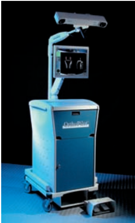
Navigationssystem „OrthoPilot“. (B. Braun Aesculap)