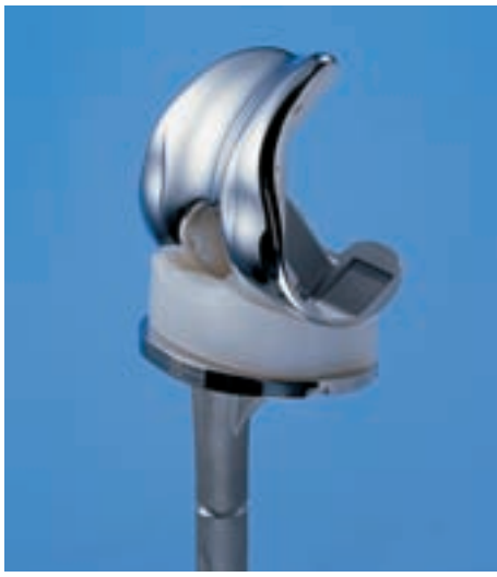
Bicondylärer Oberflächenersatz mit modularer Tibia-Stielverlängerung. (B. Braun Aesculap)

Bei den Gleitpaarungen haben sich auf Grund kontinuierlicher Verbesserungen der eingesetzten Materialien in den vergangenen Jahren drei sehr abriebarme Kombinationen durchgesetzt, die insbesondere bei jüngeren Patienten zum Einsatz kommen: Metall-Metall, Keramik-Keramik und hochvernetztes Polyäthylen-Keramik. Die verbesserte Tribologie begründet den Trend zur zunehmenden Verwendung von so genannten Großköpfen mit den Vorteilen eines verbesserten Bewegungsumfanges (range-of-motion), einer höheren Luxationsstabilität und eines beidseitigen Impingements.