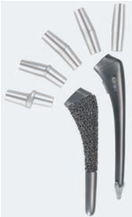
Modularer zementfreier und zementierter Hüftstiel (Typ ESKA Adapter-Hüftstiel GHE mit variablen Konusadaptern).