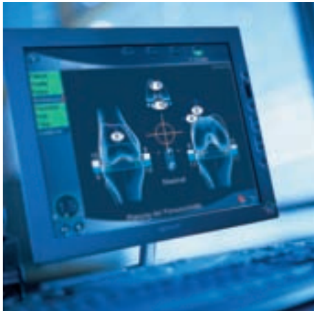
Navigationssystem „OrthoPilot“. (B. Braun Aesculap)