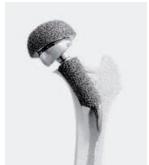
Schenkelhals-Endoprothese mit Großkopf (Typ ESKA CUT A).