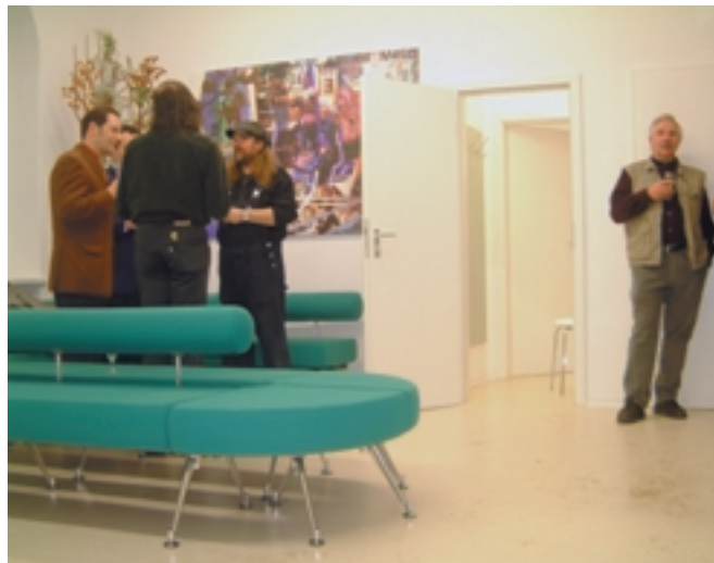
... und wiederhergestellte Praxisräume.

Ärzte in Sachsen durch das Hochwasser vom August 2002 erlitten haben. Menschlichkeit und Kollegialität haben durch die Hochwasserfolgen eine hohe Bedeutung erlangt. Es war zum Teil überraschend, auf welchen Wegen Geld für eine Spende gesammelt wurde.“