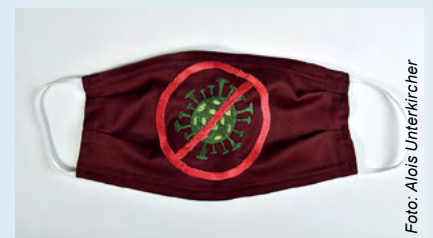
Schutzmaske im Corona-Design, Dritan K., 2020

Das Deutsche Medizinhistorische Museum in Ingolstadt sammelt Corona-Schutzmasken – Wie sammelt man eine Pandemie? Mit dieser Frage setzen sich derzeit viele medizinhistorische Museen und Sammlungen auseinander. Denn sie sind, wenn man so will, die „Experten für Seuchenobjekte“ par excellence. In ihren Sammlungen bewahren sie die unterschiedlichsten Dinge auf, die einen Eindruck davon geben, wie die Einzelnen und die Gesellschaft früher mit Seuchen umgegangen sind. Zugleich stehen sie vor der Herausforderung, nicht nur zurück in die Geschichte zu blicken, sondern zugleich das aktuelle Geschehen gut überlegt zu dokumentieren.