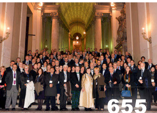
Weltärztebund zu Besuch im Vatikan.