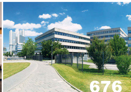
Jahresbericht der Bayerischen Ärzteversorgung.