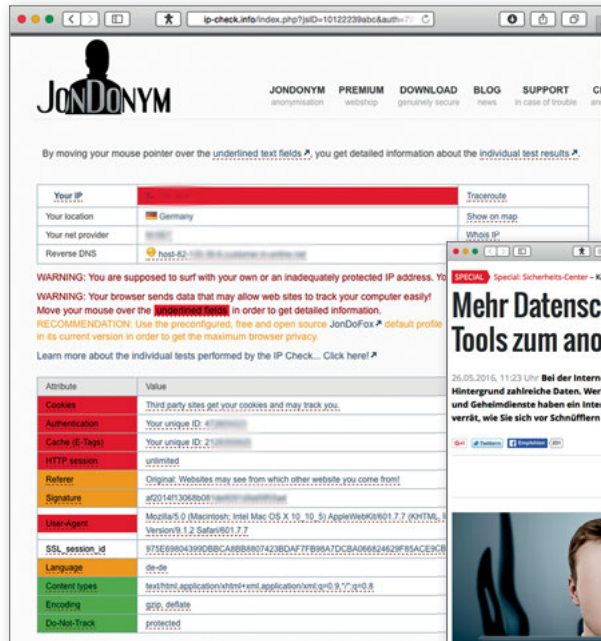
Bei einem Test zeigt diese Seite alle offenen Stellen: http://ip-check.info/?lang=en

Eine Diplomarbeit zum Thema gibt es ebenfalls schon: http://bfp.henning-tillmann.de/downloads/Henning%20Tillmann%20-%20Browser%20Fingerprinting.pdf