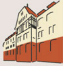
AHG Klinik Römhild