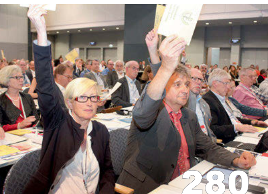
119. Deutscher Ärztetag