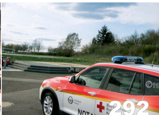
Mehr Respekt, bitte!