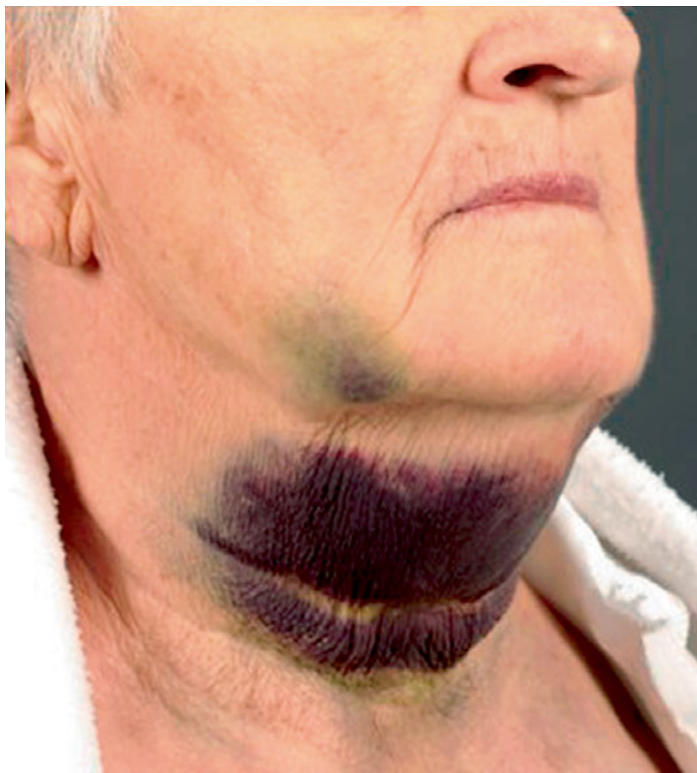
Abbildung 1: „Blauer Fleck“ am Hals.

Eine 74-jährige Patientin, ehemals starke Raucherin, stellt sich mit seit Tagen zunehmender Heiserkeit und Dyspnoe in einer hausärztlichen Praxis vor. Auffällig ist ein „blauer Fleck“ am Hals, dem die Patientin zunächst keine große Aufmerksamkeit geschenkt hat. Ein Trauma ist ihr nicht erinnerlich.