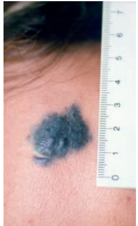
Abbildung: Das maligne Melanom tritt nicht nur an sonnenexponierten Stellen auf, sondern betrifft die gesamte Haut und Schleimhaut.

Therapeutisches Ziel bei unkomplizierten akuten Kreuzschmerzen sind die Schmerzlinderung und die Prävention chronischer Verläufe. Letzteres lässt sich durch aktive Einbeziehung des Patienten erreichen, um sie so früh wie möglich zur Aktivität zu bewegen. Zur akuten Schmerzlinderung werden Paracetamol und NSAR wie Ibuprofen oder Diclofenac symptomatisch und oral eingesetzt. Eine parenterale Applikation von Diclofenac ist wegen der Gefahr einer Anaphylaxie und anderer Komplikationen kontraindiziert. Muskelrelaxantien reduzieren Kreuzschmerzen, allerdings treten Nebenwirkungen