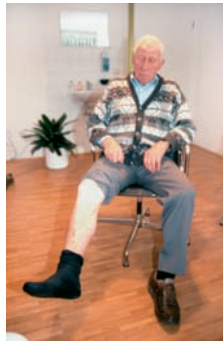
Abbildung: Das geriatrische Assessment ermöglicht die Beurteilung der Sturzgefahr von älteren Menschen.

Das geriatrische Assessment hat in der vergangenen Zeit eine große Verbreitung im ambulanten Bereich gefunden und ist ein hervorragendes Instrument, die Funktionsfähigkeit eines Patienten im Langzeitverlauf zu dokumentieren, gegebenenfalls auch drohende Funktionsverluste abzuwenden. Als Beispiel zum Thema Mobilität kann die DEGAM-Leitlinie „Älterer Sturzpatient“ herangezogen werden. 85 Prozent der Stürze älterer